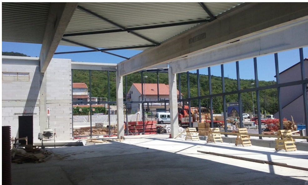
Slika 3. Pogled na spregove cjevastog profila