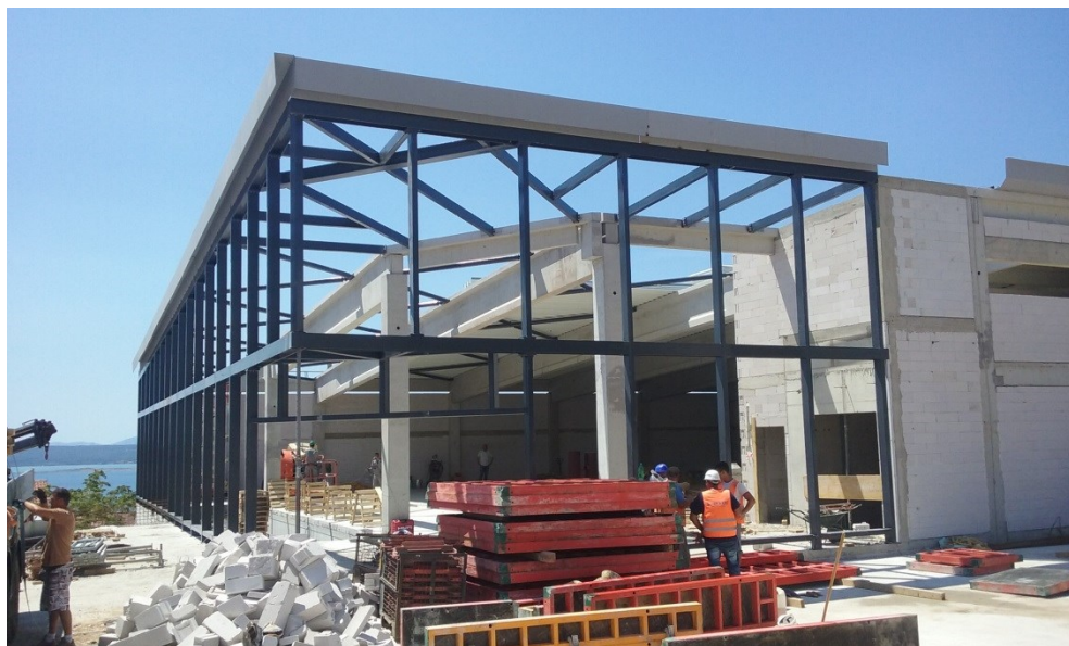
Slika 2. Pogled na konstrukciju fasade kvadratnog profila

Izjava o svojstvima je dokument koji sadrži potrebne podatke o proizvođaču, vrsti i namjeni proizvoda te svojstvima proizvoda (dimenzije, tolerancije dimenzija i oblika, zavarljivost, udarna žilavost, reakcija na vatru, trajnost, opterećenja i dr.). Na izjavi o svojstvima potrebno je naznačiti identifikacijski broj tijela za ocjenu sukladnosti te mora biti potpisana od strane voditelja tvorničke kontrole proizvodnje.