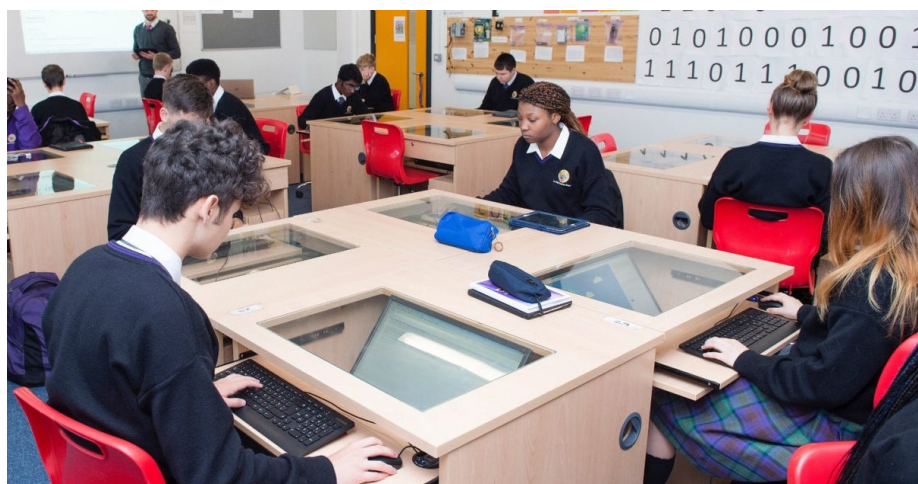
Slika 9. Prostori za učenje, škola Le Chéile, Irska