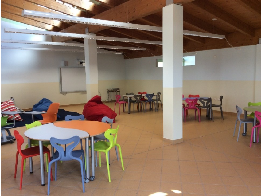
Slika 13. Prostori za učenje, Istituto Comprensivo di Cadeo e Pontenure