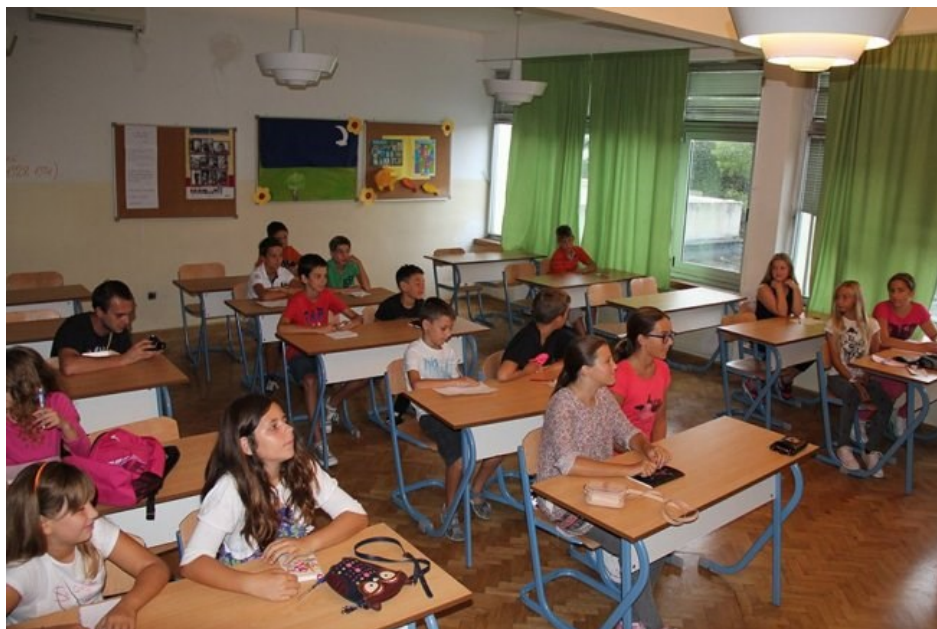
Slika 1. Tradicionalna učionica

pokušaje unaprjeđenja različitih struka - pedagoga, arhitekata, dizajnera školskog namještaja i drugih [2]. Učionice 19. stoljeća i prve polovice 20. stoljeća projektirane su s ciljem postizanja reda, discipline i školske higijene, čimbenika koji su smatrani preduvjetima dobrih edukacijskih praksi i pedagoških standarda (Slika 1). U njima nalazimo ploču, stolove i stolice za učenike, katedru za nastavnika, ormare za pohranu didaktičkih materijala i različite edukativne ilustracije po zidovima. Ploča služi kao žarište pažnje učenika i najvažniji je prostor transfera znanja u učionici.