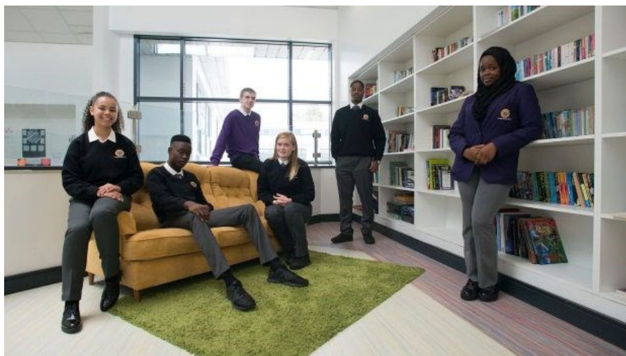
Slika 8. Prostori za učenje, škola Le Chéile, Irska