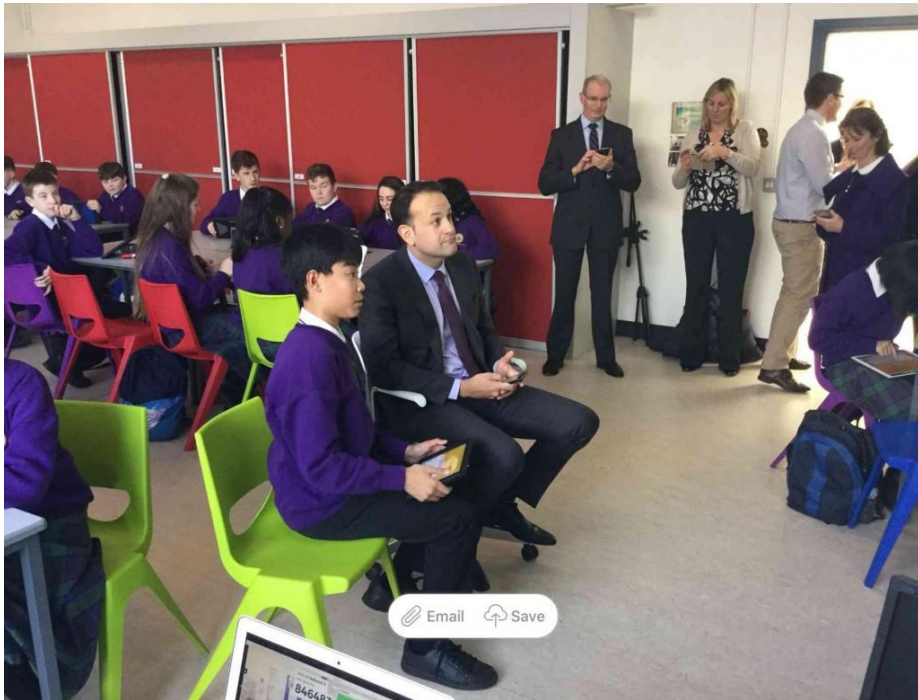
Slika 10. Prostori za učenje, škola Le Chéile, Irska