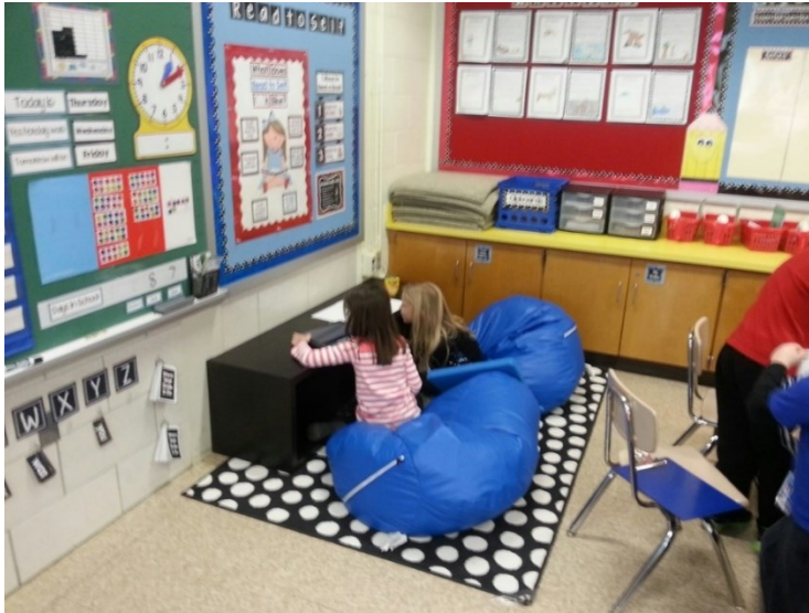
Slika 3. Personalizirano učenje u učionici 21. stoljeća

upotrebe novih tehnologija, njihov uspjeh i ocjene u velikoj mjeri ovise o tradicionalnom testiranju i rezultatima testova i ispita.